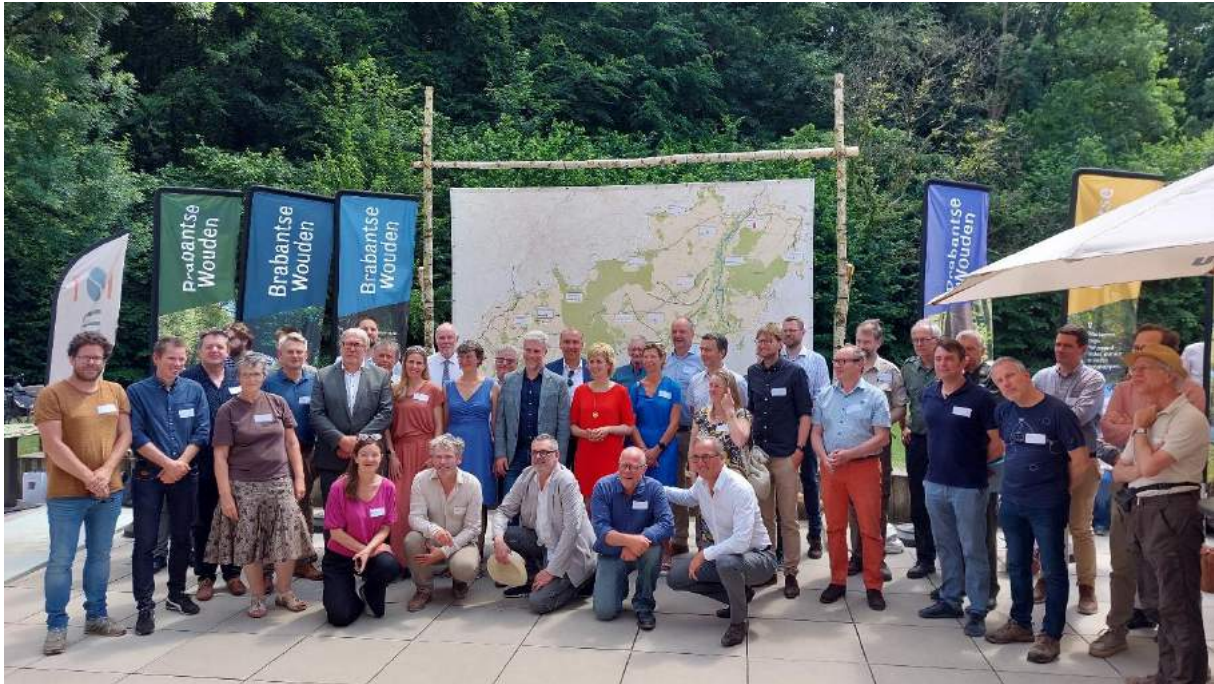
Photo de groupe avec les Ministres, les Députés provinciaux, les gestionnaires forestiers et les différents partenaires des trois régions.

7 juin 2023 – Forêt de Soignes, au cœur des Forêts du Brabant